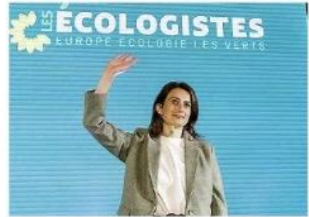
Marine Tondelier porte le nouveau nom sur les fonts baptismaux.

Avant de compléter : « Les modalités de participation différencient aujourd'hui. Nous ne sommes plus à l'époque du "Ou s'encarte". Il y a une volonté d'incarner une nouvelle étape, même s'il ne faut bien sûr pas se montrer dépréciatif avec les militants encartés. Mais l'idée reste d'associer le plus grand nombre à la cause. » Et, partant,