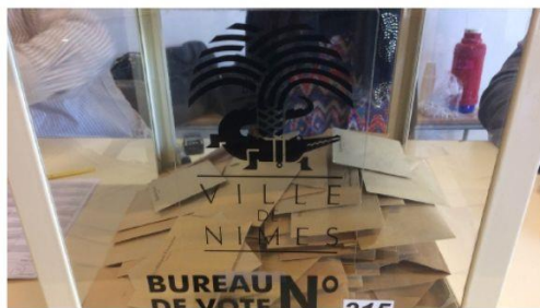
Une urne nîmoise (Photo Anthony Maurin).

Cette action est fondée sur un constat : les femmes sont encore sous-représentées dans les lieux de pouvoir, tant politiques qu'économiques. Elle s'appuie sur une conviction : de nouvelles avancées peuvent être réalisées. Elle se manifeste par un engagement : œuvrer collectivement pour que progressent la perception des disparités et leur effacement progressif par les lois, actuelles et futures.