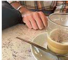
« Il m'avait promis l'enfer, je le vis »

« La gendarmerie, une femme, m'a dit : "Oui, il a été violent, mais il vous a offert des fleurs". Donc, en