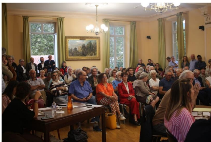
La salle du conseil municipal était comble pour cette élection.