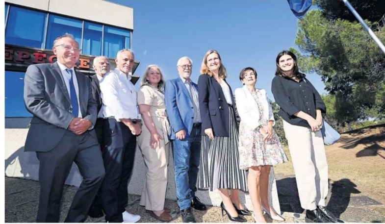
Yaël Braun-Pivet et les députés qui l'ont interrogée.

Il est urgentissime que l'on se préoccupe de cela. Sinon notre démocratie péritra. Nous avons également adopté un texte pour permettre aux représentants d'être assistés par les associations d'élus. Il faut évidemment soutenir ces associations dans leurs dotations. J'imagine aussi que vous avez l'oreille du préfet de département ou de la région pour vous assister. Nous avons beaucoup parlé avec le président de la République et les chefs de partis de la question de la simplification et du fait qu'il fallait redonner de la puissance au couple maire-préfet. C'est quelque chose qui est demandé par beaucoup de maires qui ont besoin de s'appuyer sur les services de l'État. Je pense qu'avec l'agenda rural nous avons bien avancé. Les ministres sont à l'écoute. L'hôpital pas à faire entendre votre voix. Vous avez l'oreille de l'Assemblée. Et je suis sûr celle du Sénat.