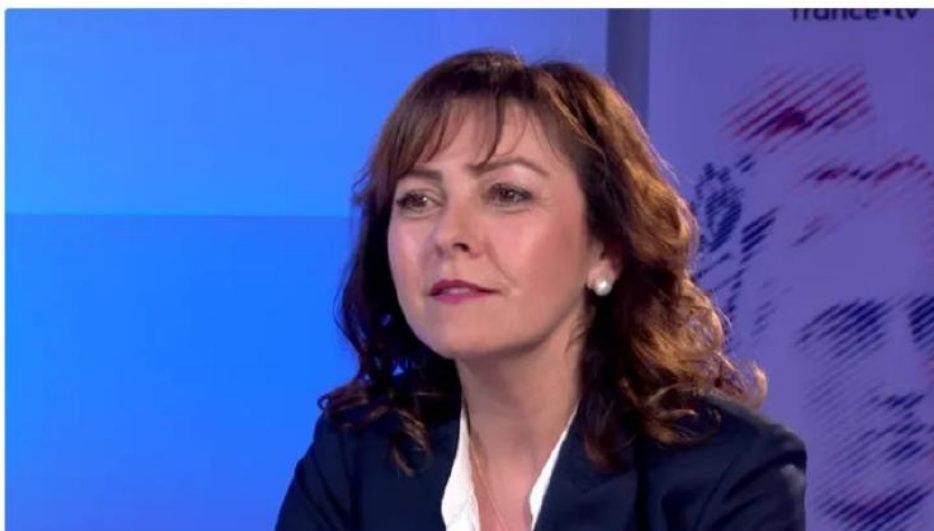
Carole Delga, Présidente PS de la région Occitanie •

Mais près de 25 ans après, le bilan est mitigé. "Ce processus s'essouffle" , remarque le HCE, qui a présenté des préconisations "tant sur le plan constitutionnel, législatif et réglementaire que culturel" . Objectif : "mener un acte II pour la parité" .