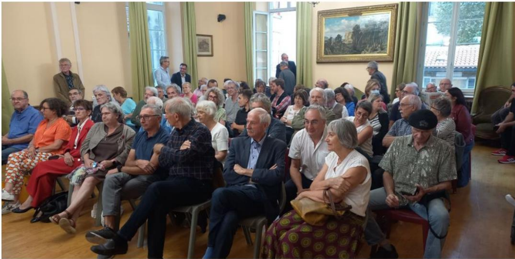
Dans le public venu en nombre, famille et amis de la nouvelle maire.