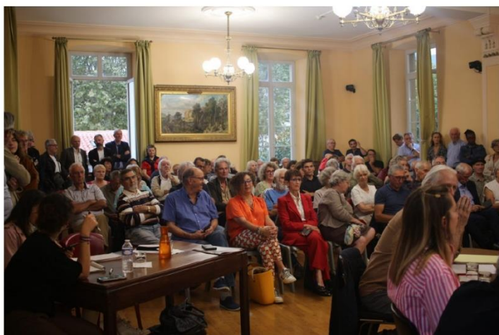
La salle du conseil municipal était comble pour cette élection.