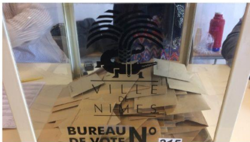
Une urne nîmoise.

Cette action est fondée sur un constat : les femmes sont encore sous-représentées dans les lieux de pouvoir, tant politiques qu'économiques. Elle s'appuie sur une conviction : de nouvelles avancées peuvent être réalisées. Elle se manifeste par un engagement : œuvrer collectivement pour que progressent la perception des disparités et leur effacement progressif par les lois, actuelles et futures.