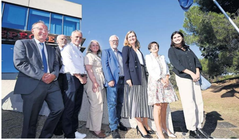
Yaël Braun-Pivet et les lecteurs qui l'ont interrogée.