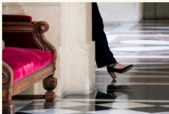
Dans la salle des quatre colonnes à l'Assemblée nationale, Paris, 3 mai 2018.

Un rapport remis en décembre 2022 pointe du doigt le manque de femmes en politique. L'observatoire régional de la parité d'Occitanie lance un appel pour plus d'inclusion et de représentativité. L'instance plaide pour un "acte II" de la parité.